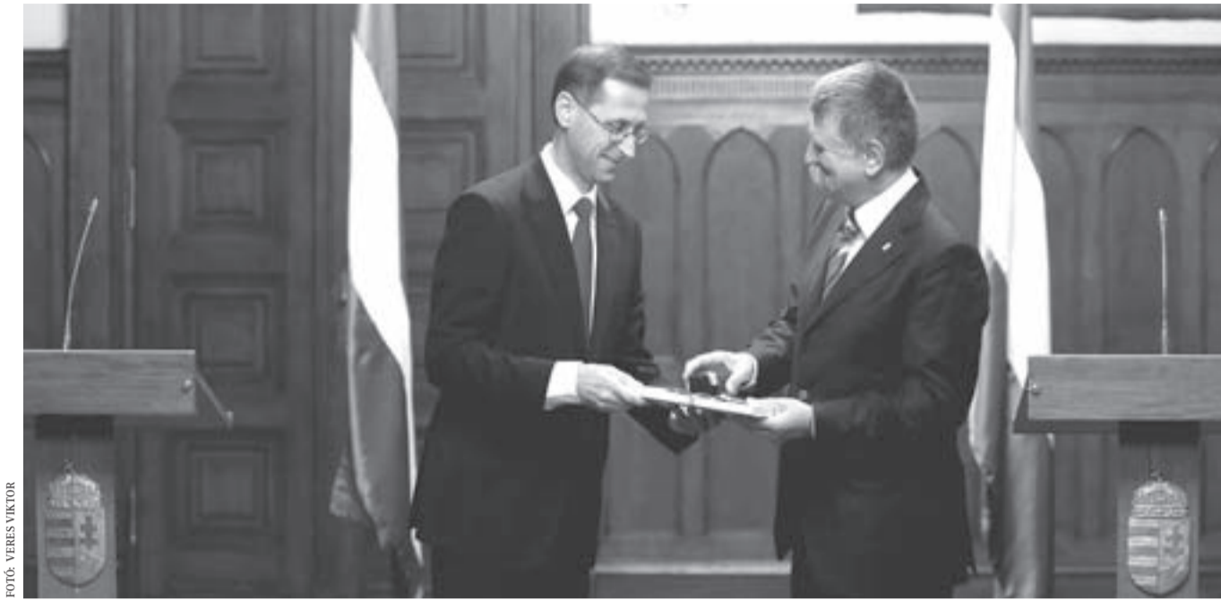
Varga Mihály nemzetgazdasági miniszter a jövő évi büdzsé benyújtásakor Kövér László házelnökkel

KÖLTSÉGVETÉS Rosszabb helyzetben vagyunk a régiós országoknál